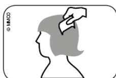
Fig. Pasar la lendrera por el cabello mojado, desde el cuero cabelludo hasta las puntas.